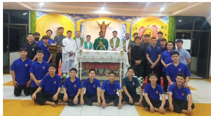
Il Superiore Regionale della Regione Santa Maria di Gesù Crocifisso, accolto nella comunità di formazione di Sampran durante la sua visita al Vicariato di Thailandia-Vietnam.

che Gesù Cristo, centro della nostra vita e nostro Salvatore, ci invita alla missione della formazione betharramita.