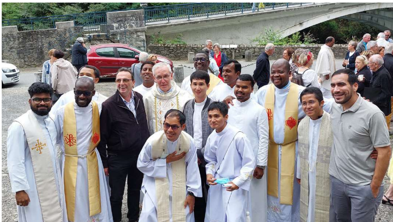
Giovani artefici di pace e di felicità (ultima sessione di formazione a Betharram del 2022)

magini e i ruoli che gli altri possono farci interpretare. Fare verità su se stessi è la strada necessaria per trovare la felicità nella relazione con gli altri. La vita fraterna in comunità è una gioia da vivere insieme. Come ha detto uno dei nostri anziani, ci viene chiesto di rinunciare a molto, ma non al desiderio di vivere felici.