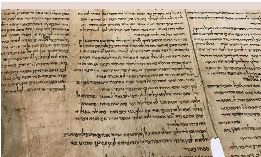
Il Rotolo di Isaia, il più importante dei rotoli di Qumran.

Un altro aspetto chiave della pace evidenziato in 26, 3 è l'affermazione del profeta secondo cui coloro che hanno una "prospettiva dipendente" in contrapposizione all'orgoglio-