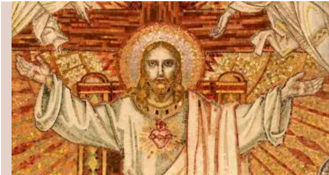
Mosaico della cappella del Sacro Cuore a Hasparren.

missione per i baschi a Buenos Aires, in Argentina, nei primi mesi del 1897.