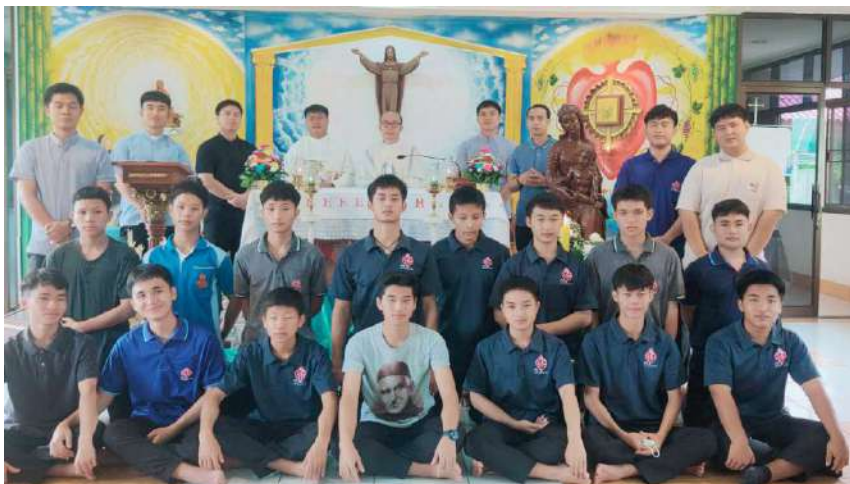
Giovani in formazione a Sampran Ban Garicoits

hanno sparso il seme della fede che ha messo radici nei cuori della gente nella cultura delle comunità tribali nella parte settentrionale della Thailandia.