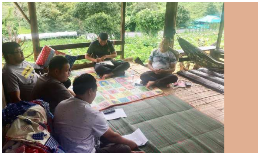
Il ritiro spirituale, un'opportunità che ci è offerta per rinnovare e approfondire il significato della nostra vita religiosa come membri della famiglia betharramita.

una volta all'anno e in altre occasioni speciali. Questa è un'opportunità che ci è offerta per rinnovare e approfondire il significato della nostra vita religiosa come membri della famiglia betharramita.