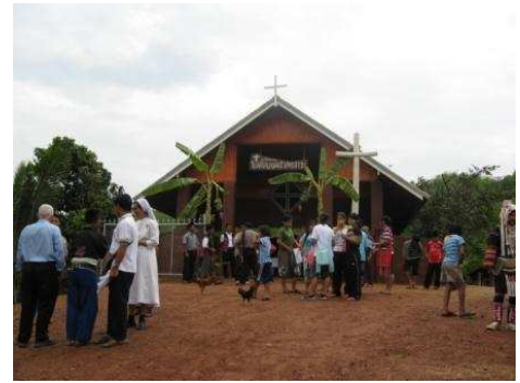
Elise de Panklang

A Balaa, Huaynamrin, Ban Jong, Huay Rai, entre autres villages nous devons aussi renouveler l'église. Les constructions dans les villages viennent de coûter environ 12.000 Euros. Huay Rai est un gros village qui prend chaque jour plus d'importance, il s'est formé récemment et compte 230 familles. Et pour la construction il nous faudra un minimum de 60.000 Euros. Je me demande comment il sera possible de faire face à ces dépenses avec la crise actuelle. Je suis convaincu que, malgré tout, avec le temps, les gens pourront se réunir et prier dans des structures plus stables.