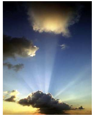
Foi: une lumière dans la nuit

Dieu, fais-nous revenir ; Que ton visage s'éclaire, Et nous serons sauvés ! (psaume 79)