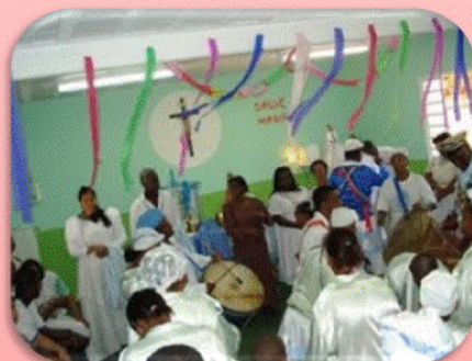
Os tambores que homenageiam à Mãe de Jesus... A capela ficou pequena para tanta alegria e fé...