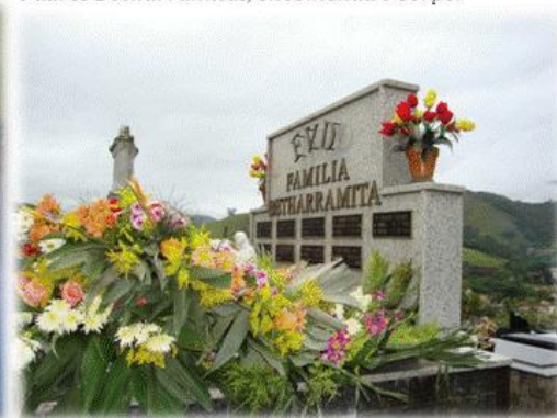
Jazigo da Família Betharramita. Aqui descansam os restos dos Betharramitas falecidos no Brasil.