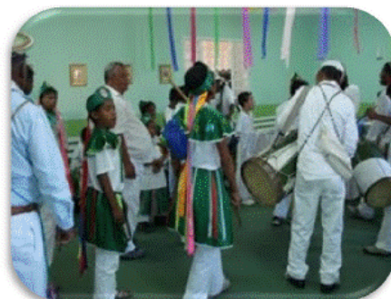
As cores da festa...