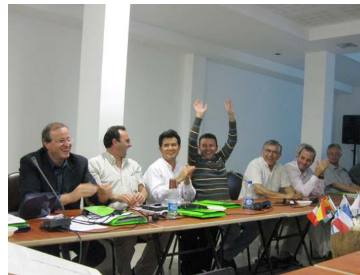
...(comme ici, en 2011), la collégialité ne renforce-t-elle pas les liens de famille dans l'amitié... et dans la joie ?

Le lieu le plus approprié de la communion et de la participation est la communauté, avec un projet bien défini, élaboré avec la participation de tous et réalisé avec l'engagement et le sens de la responsabilité de chacun des frères.