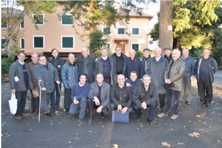
Des assemblées de vicariat (ici, Italie du Centre/Sud en 2010), et des chapitres régionaux, au chapitre général...

une proportion d'un représentant pour chaque 15 religieux ou partie (Statut 8).