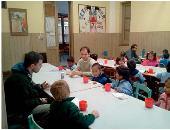
À la "Casa de los niños"

Vous évoquiez peu avant la "Casa del Niño" ("Maison de l'Enfant"). De quoi s'agit-il ? - C'est une garderie qui accueille des enfants de 2 à 4 ans, en semaine, de 8h du matin à 5h le soir. Cette Maison de l'Enfant a été fondée il y a 40 ans par les PP. Ierullo et Daleoso, avec