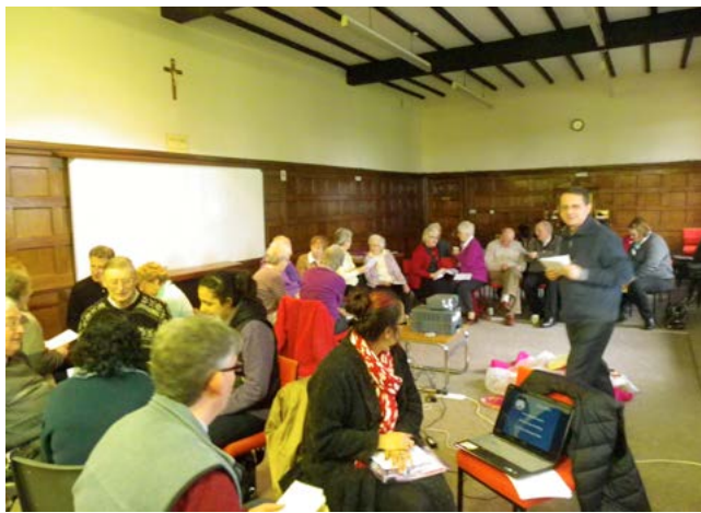
Religieux bétharramites, Religieuses et laïcs réunis pour une retraite commune à Widney Manor, près de Solihull.

Tous les présents sont arrivés (parfois non sans peine) à faire un discernement sur la différence entre un bonheur superficiel sans consistance et la joie bien enracinée que l'on ressent lorsqu'on réalise combien Dieu nous aime et nous