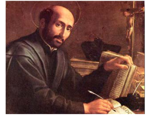
San Ignacio de Loyola