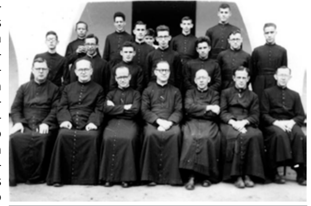
Religiosos en Brasile - 1954