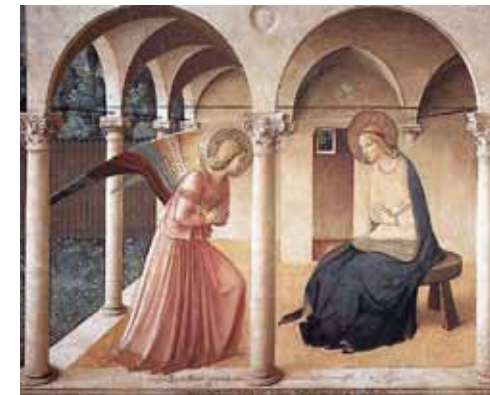
Ecce Ancilla Domini... Fresco del Beato Angélico Convento de S. Marcos, Florencia

Un cambio de comunidad y de misión tiene que ser considerado de entrada como un bien para el religioso, que aunque le exija una renuncia, le abre a nuevas posibilidades, aportándole una riqueza y un crecimiento personal. En el seno de comunidad, el superior en un servidor de Dios para el bien (Rm.13,4; RdV. 67). El servicio del superior de la comunidad tiene que favorecer la unidad de la comunidad en torno a la fidelidad de cada uno al Carisma de San Miguel Garicoits. Éste tiene que hacerlo conociendo, valorando y estimulando los dones de cada religioso, facilitando la creatividad y la audacia misionera, poniendo en guardia contra el activismo que puede poner en peligro