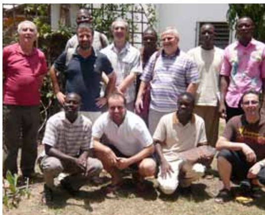
La comunidad de Bouar-Niem

¿Qué fue lo que caracterizó la misión de la comunidad en el comienzo? - Hay que tener en cuenta que antes de nuestra llegada, el amplio territorio de la misión