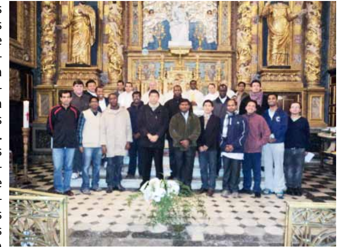
Grupo de los participantes en la sesión 2012

Pero fueron preciosos los encuentros cotidianos con los ancianos de la "Maison