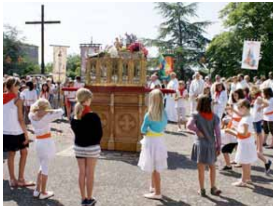
Fiesta de Santa Germana en Pibrac, en el 2011