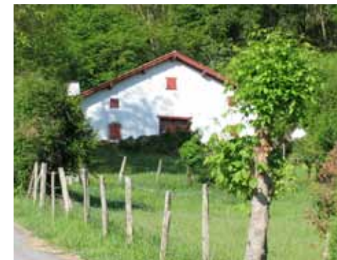
Ibarre: el origen humilde de san Miguel

El espíritu de pobreza y el compartir es lo que nos hace a todos iguales y lo que nos ayuda a construir la comunión, que es el gran valor de la comunidad religiosa y el gran valor de la Iglesia en el mundo de hoy, pues como dice Juan Pablo II, la Iglesia es casa y escuela de comunión. Esta igualdad en el no disponer de bienes es fundamental para que nuestra fraternidad sea auténtica. Por eso, los que poseen bienes, tienen que deshacerse de ellos al entrar en comunidad. No es posible que haya en la comunidad unos religiosos con bienes y otros sin ellos, como sucedía en el Monasterio de la Encarnación de Ávila cuando ingresó en él Santa Teresa. Antes de la primera