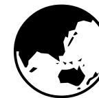
Región Beata María