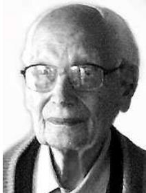
Monte Corrado (Italia) 8 de septiembre de 1911