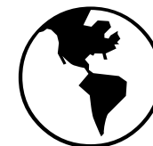
Región Padre Etchecopar