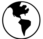
Región Padre Etchecopar