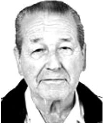
Martínez 12 de mayo de 1926