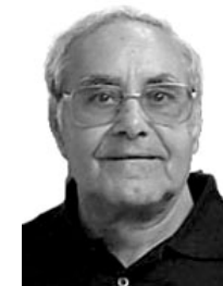
Laguna Dalga (España) 22 de julio de 1945