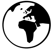
Región San Miguel