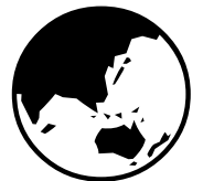
Región Beata Mariam