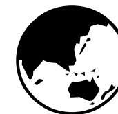
Región Beata Mariam