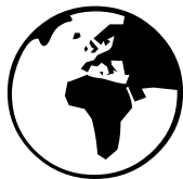
Región San Miguel

Plaza Padre Airoldi ■ 40 años después de la consagración de la Iglesia del Sagrado Corazón, la