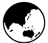
Région Bienheureuse Mariam