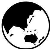
Región Beata Mariam