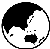
Región Beata Mariam