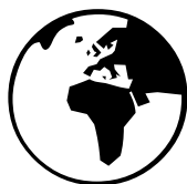
Región San Miguel