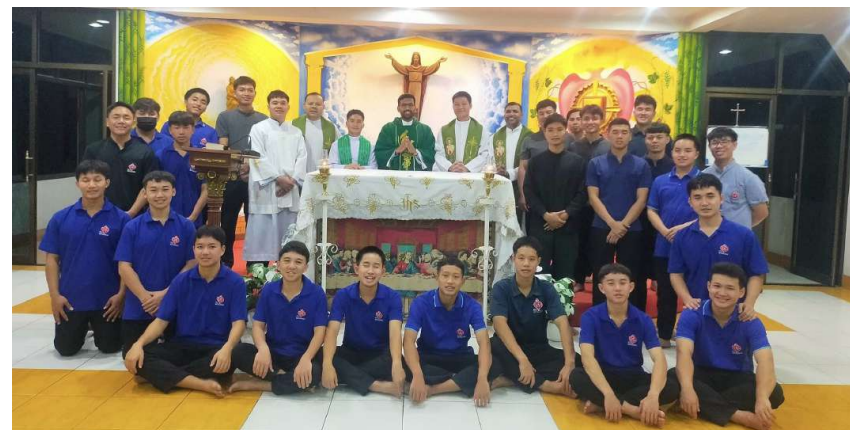
Le Supérieur régional de la Région Sainte Marie de Jésus Crucifié, accueilli dans la communauté de formation de Sampran au cours de sa visite au Vicariat de Thaïlande-Vietnam.

sommes rappelés que c'est Jésus-Christ, centre de notre vie et notre Sauveur personnel, qui nous invite à la mission de formation de Bétharram.