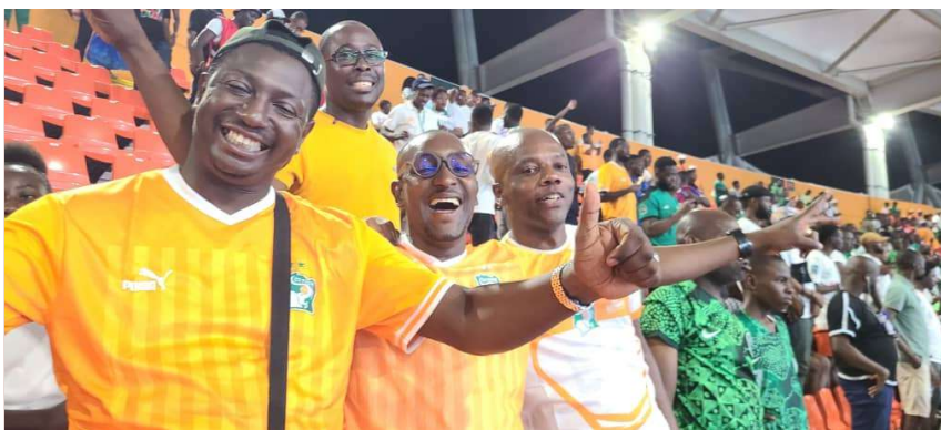
Il est important de savoir cueillir les occasions pour communier et consolider nos liens.

nouissement. L'œuvre de paix de Dieu a atteint sa plénitude dans la personne et l'œuvre de Jésus-Christ, une œuvre de salut, de pardon, de réconciliation.