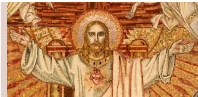
Mosaïque de la chapelle du Sacré-Cœur à Hasparren.

à Hasparren ; il y eut enfin la fondation d'une mission pour les Basques à Buenos Aires, en Argentine, au début de 1897.