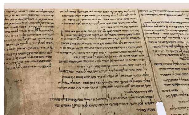
Le Rouleau d'Isaïe, le plus important des rouleaux de Qumrân.

rans et en brisant l'orgueil humain de la ville haute. Mais dans les versets 26, 1-6, l'attention se déplace insensiblement vers l'état spirituel de ceux qui se trouvent à l'intérieur des portes du salut, état décrit comme un sentiment de paix et de protection. La cité de Jérusalem est une forteresse dont les murailles sont une garantie de salut, une promesse que Shalom sera préservée.