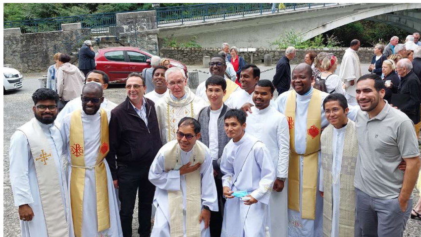
Jeunes artisans de paix et de bonheur (dernière session de formation à Bétharram en date, 2020)

En religieux de Bétharram, je suis invité à être en présence du Seigneur et à être signe de la présence de Dieu pour les autres. Jésus, par sa présence, a témoigné que chaque homme est aimé de Dieu. Moi, en tant que religieux, je porte cette présence du Dieu aimant. Étant conscient de sa présence, vouloir la paix, c'est agir en se disant que chaque être humain est précieux aux yeux de Dieu et donc précieux à mes yeux ! Tous pour la paix ! ■