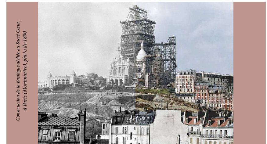
Construction de la Basilique dédiée au Sacré Cœur à Paris (Montmartre), photo de 1890

Pour diverses raisons, l'élan amorcé dans la seconde moitié du XVII e siècle, comme nous l'avons indiqué, fut quelque peu ralenti et les commandements du Cœur de Jésus à sainte Marguerite-Marie ne pourront être complétés qu'au milieu du XIX e siècle, quand la dévotion connaîtra un regain encore plus fort, au point de