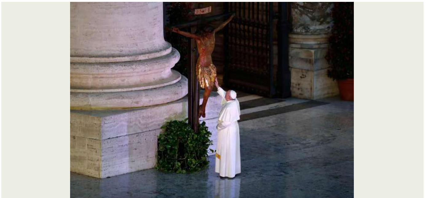
Le pape François devant le crucifix de saint Marcel pour la prière du 27 mars, place Saint-Pierre

Dans ce silence, on peut entendre une petite voix discrète et à peine audible. « Oui, n'aie pas peur, la vie est en toi. La vie est autour de toi. Regarde