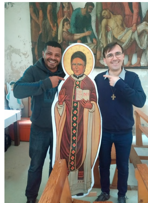
Formateurs en session :

L'interpellation issue de la réflexion de notre dernier Chapitre général constitue, tant pour la formation initiale que pour la formation permanente, un défi et une aventure qu'il