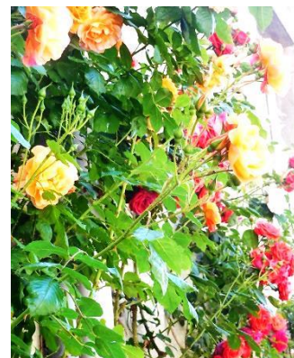
roses de betharram

Le Jeudi Saint, Jésus prie ainsi Notre Père : « Les hommes étaient à vous, je vous les ai gardés ... Père Saint, gardez-les, tous ceux que vous m'avez confiés ... Père, ceux que vous m'avez donnés, je veux que là où je vais, ils soient avec moi ... »