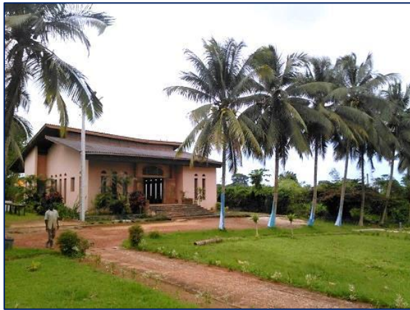
Maison de formation d'Adiapodoumé (C. Ivoire)

Il appartiendra à la congrégation de voir un ou deux religieux qui pourraient s'impliquer directement dans ce projet même si d'autres peuvent apporter un appui. Déjà un groupe existe autour de Pibrac et c'est bien ainsi ; il y aura nécessité d'élargir le groupe des jeunes. Les religieux auront à inviter ; nous pourrons aussi proposer aux laïcs de la Fraternité « Me Voici » ou des laïcs en lien avec Bétharram de s'investir d'une façon ou d'une autre, en prenant en compte aussi les relais des médias dont nous disposons.