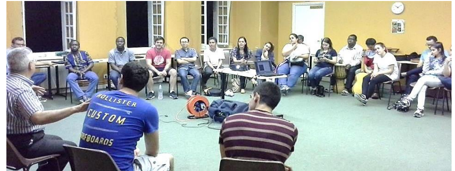
Rencontre jeunes religieux - groupe FVD du Paraguay en partance pour les JMJ de Cracovie juillet 2016 à Bétharram

Déjà des occasions de rencontres ont été vécues autour des JMJ avec des jeunes de Côte d'Ivoire ou du Paraguay. Aller à la rencontre de l'autre, connaître les communautés religieuses de Bétharram et en particulier les communautés chrétiennes qu'elles animent dans les villages et en ville. La participation à leurs célébrations (professions religieuses ou eucharistiques) pourrait apporter plus de dynamisme et de joie de vivre comme jeunes chrétiens.