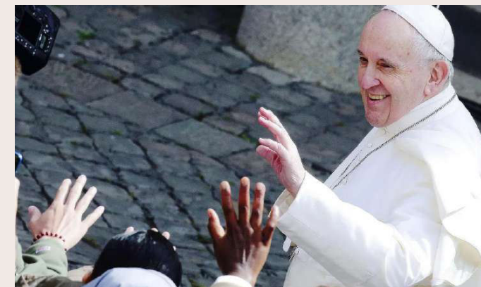
Miserando atque Eligendo

En el Nombre de la Santísima Trinidad. Amén.