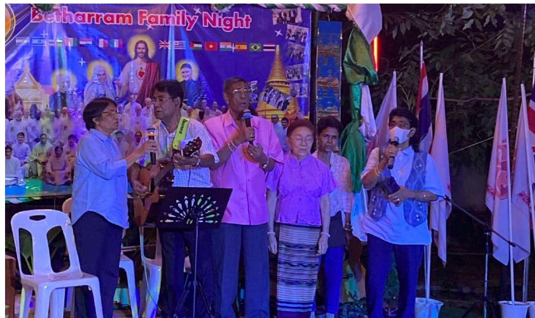
Presencia y ayuda de nuestros ex alumnos y benefactores durante el Capítulo General 2023 en Chiang Mai.

Estoy orgulloso de representar a Betharram en Saengtham, trabajando junto a los formadores diocesanos para crear un ambiente donde los estudiantes puedan sobresalir académica-