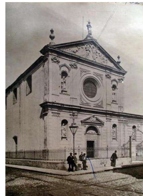
Iglesia San Juan Bautista de Buenos Aires en su aspecto primitivo y como la conoció P. Etchecopar.

El 20 de marzo salió de San José y se dirigió a la residencia de la iglesia de San Juan, donde permanecería durante una semana. La comunidad, además del servicio religioso de la iglesia, también está a cargo de la capellanía de las Clarisas Capuchinas, cuyo convento es adyacente a la residencia de los padres. “Aquí me reencuentro con los comienzos del P. Garicoits y con una de las tantas obras a