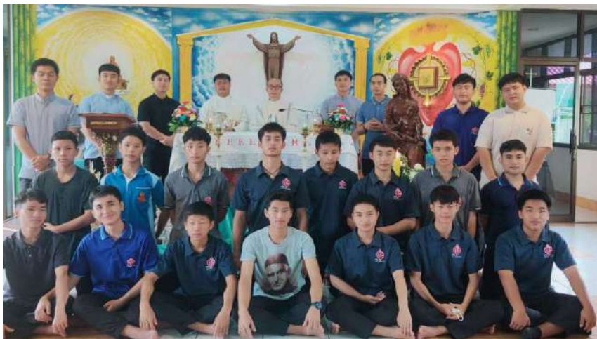
Jóvenes en formación en Sampran Ban Garicoits

proclamaron la Buena Noticia y sembraron la semilla de la fe que echó raíces en los corazones de la gente en la cultura de las comunidades tribales en la parte septentrional de Tailandia.