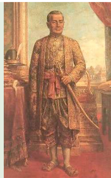
Rama I, primer soberano de la dinastía Chakri (actualmente reinante)

(fuente principal: https://www.thailande-online.com )