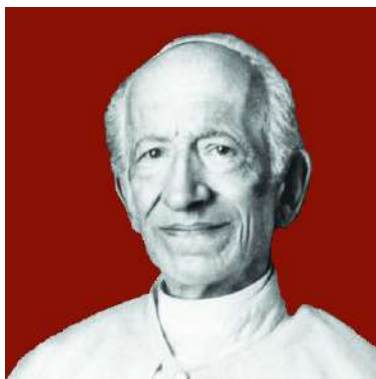
Papa León XIII

"Yo soy el Papa, respondió, soy el jefe de la Iglesia; pero tengo una edad avanzada; quisiera la paz para la Iglesia quisiera que le