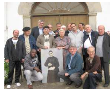
Anghelu: Recuerdo del encuentro de los religiosos hermanos betharramitas en Betharram en el 2013.

Para cada betharramita, entrar en la casa "Anghelia" representa ese "éxtasis de Oneix" en el que Miguel fue iluminado por el Dios-Amor. Es el comienzo de una familiaridad con Jesús, manso y humilde de corazón.