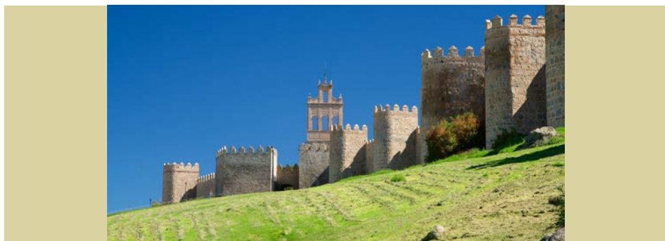
Ávila (España), donde el nuevo Superior General concedió al P. Gaspar SCJ tomarse un año de descanso para poder seguir un curso de teología mística