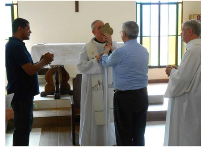
Celebración de acción de gracias en la capilla de la casa en San Bernardino después de la elección del nuevo Superior General, el 18 de Mayo de 2017

decidido en una visita: el Superior Regional se va y se hace lo contrario de lo que se decidió. A veces, ha faltado comunicación entre el Superior regional y algún Vicario. A veces, el Vicario ha tomado medidas importantes sin consultar al Superior Regional. Muchas de estas dificultades se van superando si se respetan las competencias de cada uno y se trabaja aplicando la ley de la subsidiaridad con espíritu de fe y de servicio. La regionalización ha sido una buena oportunidad para evitar el aislamiento de cada Vicariato e ir creando una mayor unidad en la Congregación, en el respeto de las diversidades culturales. Un mayor conocimiento de la RdV. por parte de todos, Superiores, Vicarios y religiosos ayudará a dialogar y a regular nuestra vida y nuestro modo de relacionarnos desde nuestra identidad de consagrados betharramitas.