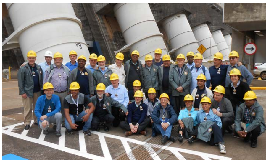
En una visita a la represa de Itaipú, los mismos, en la versión "Village People", ¡pero no se preocupen, ningún usó obligatorio del casco en las directivas del Capítulo General!

de este capítulo con una voluntad y una invitación a salir de mi YO para encontrar y compartir mi vida con mis hermanos de comunidad para que juntos podamos ponernos en camino como María para la misión de Betharram en el corazón del mundo. Confío a Nuestra Señora de Betharram a nuestro nuevo Superior General y a su Consejo; que el Señor los acompañe en su servicio para que Betharram siga, sin demora, saliendo al encuentro de la Vida.