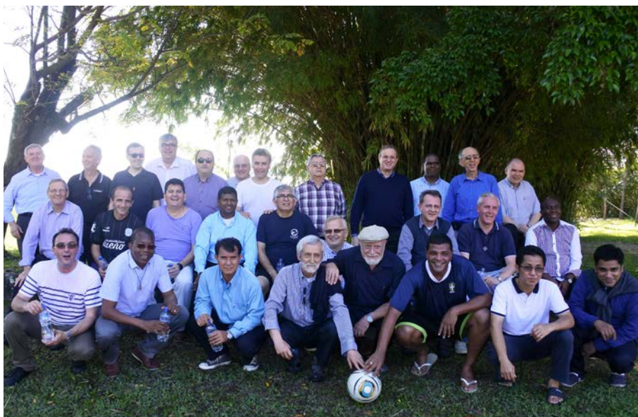
Los capitulares, en la versión "Real Madrid"...