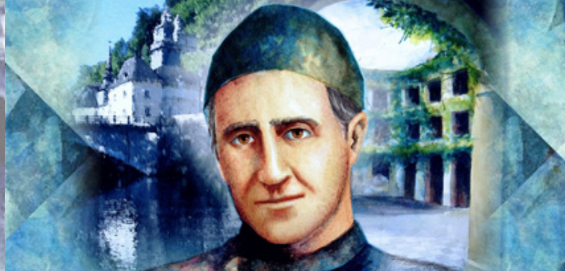
Cuadro de Juan Wladimir Martinovitch