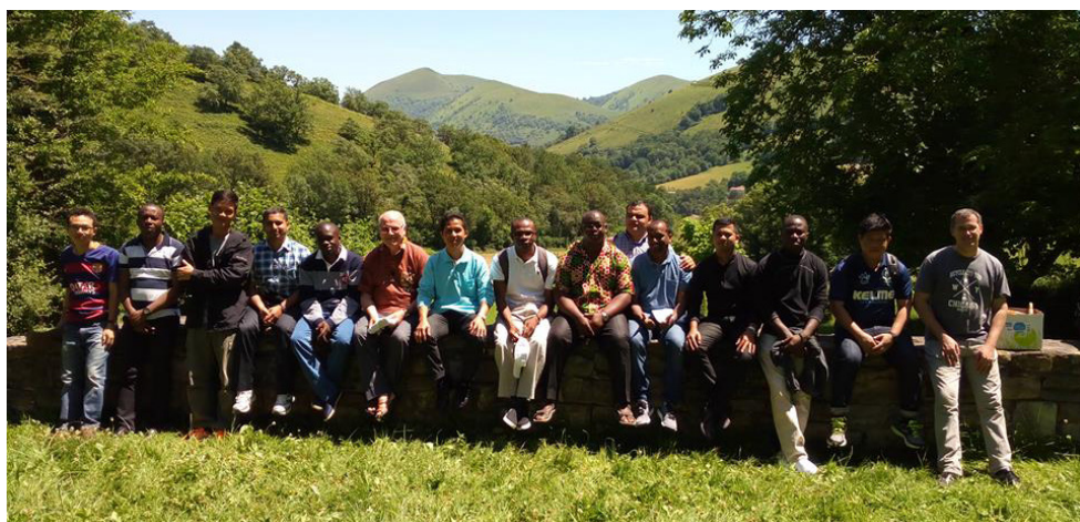
Miembros de la sesión internacional 2016

¿Además de los temas de espiritualidad, cuales son los otros elementos positivos para los participantes? La sesión da la