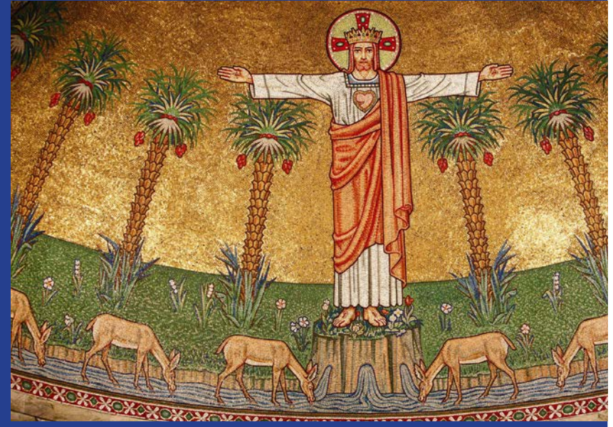
Detalles de un mosaico (siglo XXI), en la iglesia de Droitwich

zamos signos y símbolos para dar a conocer a los demás nuestra identidad interior. Entre todos los signos, los Sacramentos son los más ricos y profundos. Nuestra fe nos dice que Jesús está presente en los Sacramentos. La celebración de los Sacramentos está en el corazón del ministerio sacerdotal. Es gracias a los Sacramentos que el Señor toca nuestra vida. En la Parroquia, la celebración de los Sacramentos constituye un momento clave de nuestra vida: la celebración cotidiana de la Eucaristía en la iglesia parroquial, así como las Misas en diversas circunstancias en la escuela, en las casas para ancianos, en casa de los enfermos. Sencillamente, nuestra comunidad se hace disponible a todos en el ministerio... como dice nuestra Regla de Vida: "para procurar a los demás la misma felicidad". Estoy completamente sintonizado con San Pablo cuando dice: "No soy yo