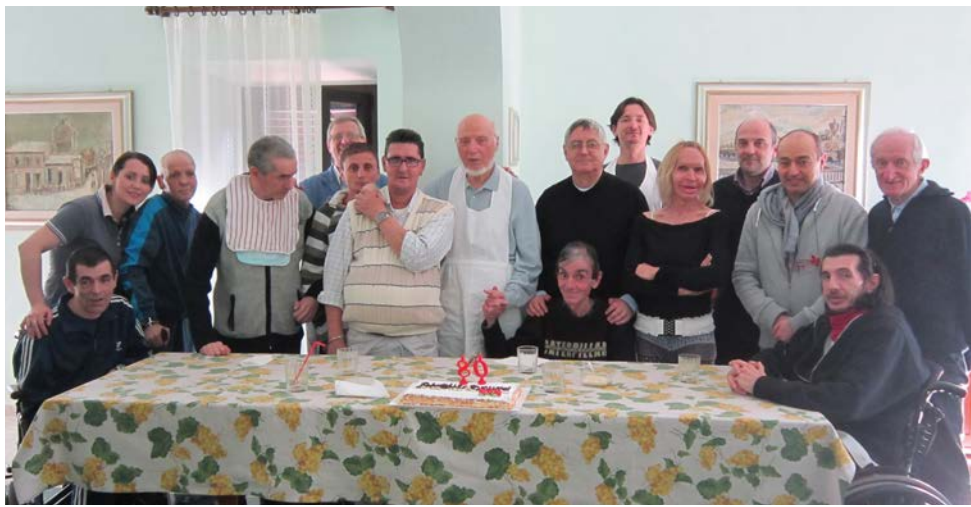
"Villa del Pino", un lindo ejemplo de familia recuperada y ampliada

Eso fue en el marzo de hace veintitrés años; desde entonces comencé a participar con cierta regularidad de la vida de la Casa Familia y de las iniciativas de la Asociación como jornadas de estudio y profundización, promovidas para entrar en el corazón del problema y permitir una aproximación cada vez