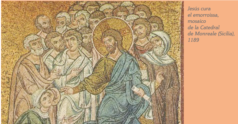
Jesús cura el emorroissa, mosaico de la Catedral de Monreale (Sicilia), 1189

- la espiritualidad para ser discípulos: reproducir y manifestar el impulso generoso del Corazón de Jesús, el Verbo Encarnado, que dice a su Padre: "Ecce venio" y se entrega a todos sus designios para la redención de los hombres (RdV. 2);