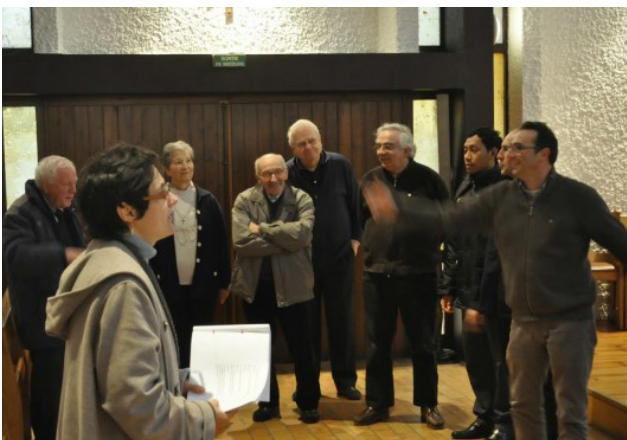
¿Encuentro de Vicariato? No exactamente: Betharramitas sorprendidos en flagrante «delito» de ensayo para el espectáculo de S. Miguel representado en Pau en 2013. ¡Un gran momento para compartir!

- Comunidad de Mendelu (España): El Capítulo General auspició la continuidad de esta presencia. Para eso acaba de llegar un religioso de Francia y otro, desde el Brasil, va a llegar en las