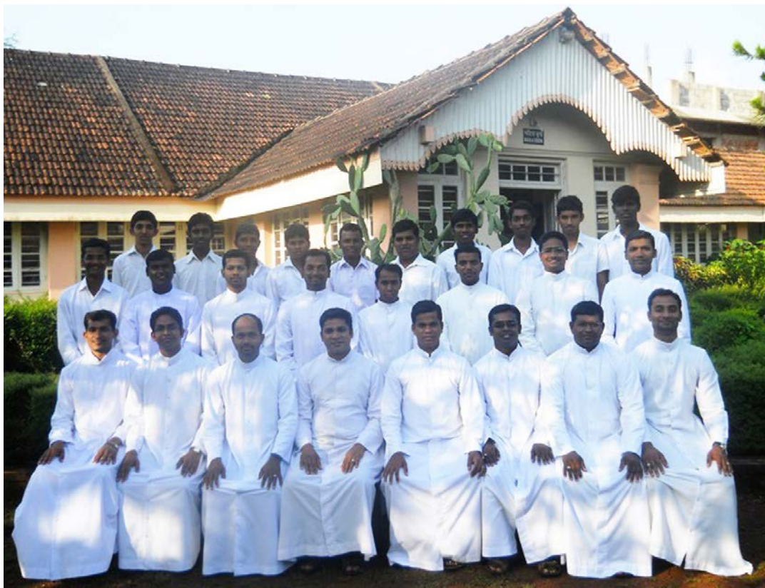
Fotografía de familia: la comunidad de Mangalore en pleno

A lo largo del curso de formadores mi director espiritual me abrió una nueva perspectiva durante una sesión centrada sobre mi crecimiento vocacional (VGS): si tienes