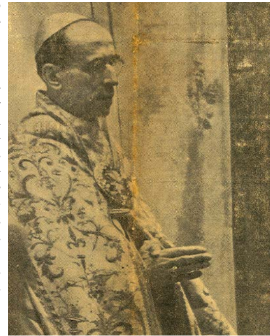
Pío XII durante el canto del « Te Deum » justo después de la canonización de San Miguel Garicoits

mortificación, abnegación, celo, caridad y se impregnó al mismo tiempo de tanta bondad que se podría muy bien aplicarle el “de