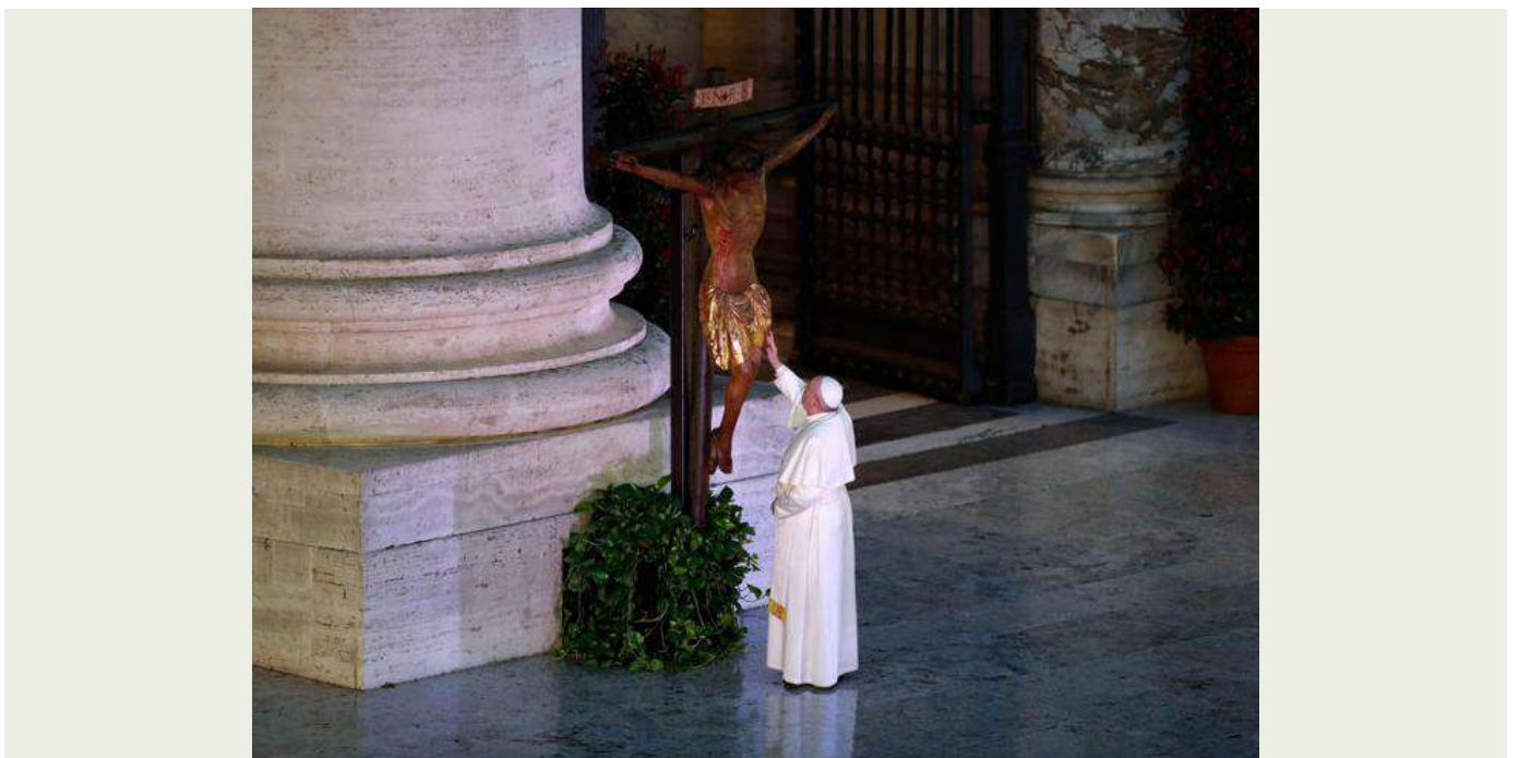
Papa Francisco ante el Crucifijo de San Marcello para la oración del 27 de marzo, Basílica de San Pedro.

En ese silencio podemos oír una pequeña voz discreta, a penas audible. "Sí, no tengas miedo, la vida está en ti. Mira todos esos gestos de vida ofrecida