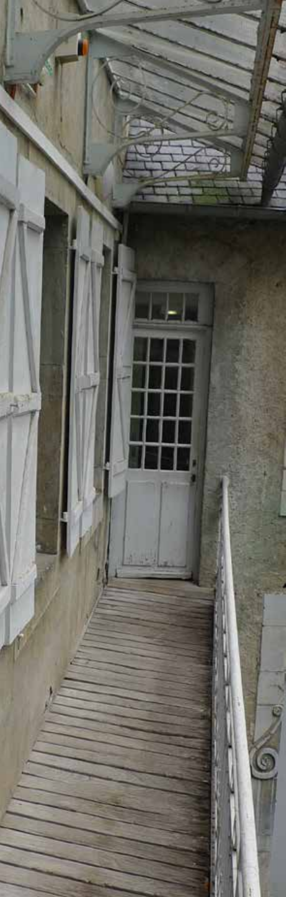
Il ballatoio di un cortile interno di Bétharram

situazione diocesana a causa della probabile vendita dei beni». L'11 settembre i periti giungono a Bétharram per visionare gli immobili. Un'altra preoccupazione ben più grave riguarda il destino dei religiosi, molti dei quali anziani o malati: la congregazione infatti non aveva residenze che potessero accogliere un centinaio di persone. L'unica via possibile era l'espatrio.