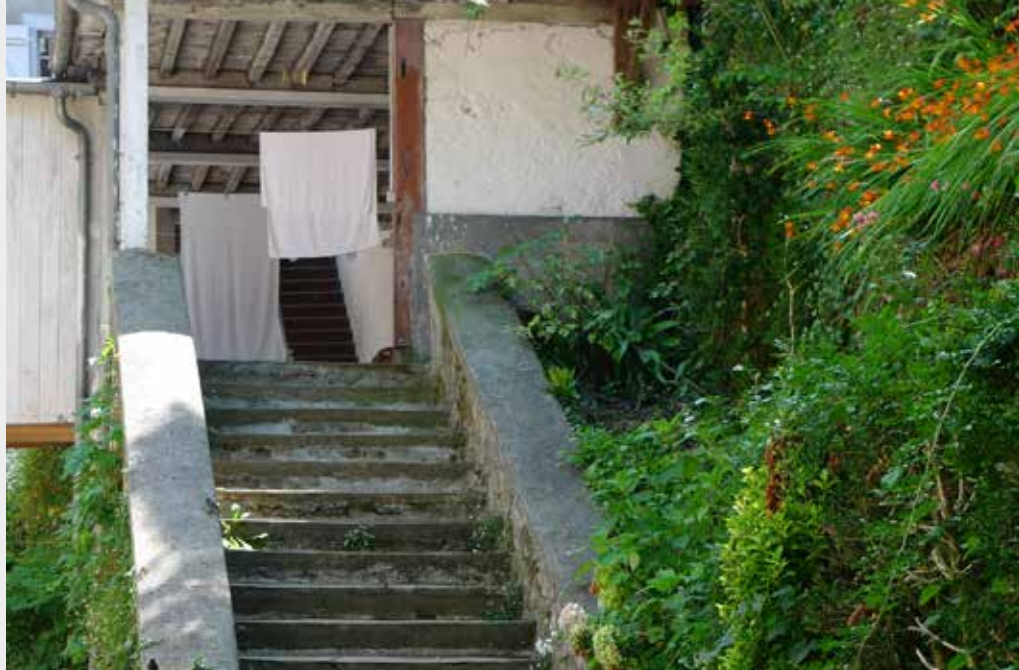
Due scorci del complesso di Bètharram

che acquisterebbe più forza se abitassero tutti insieme in Bètharram. Altri pensano infatti che la comunità debba vivere a Bètharram e da lì diffondersi in tutta la zona come i missionari del tempo di san Michele: nel collegio di Bètharram e in altre scuole cattoliche della zona, nella casa di riposo di Bètharram e in altre residenze, con un progetto missionario da offrire al vescovo di Bayonne e a quello di Tarbes e ai parroci di entrambe le diocesi. Questo progetto missionario risponderebbe maggiormente al carisma di Bètharram e al desiderio di una «Chiesa in uscita» di Papa Francesco.