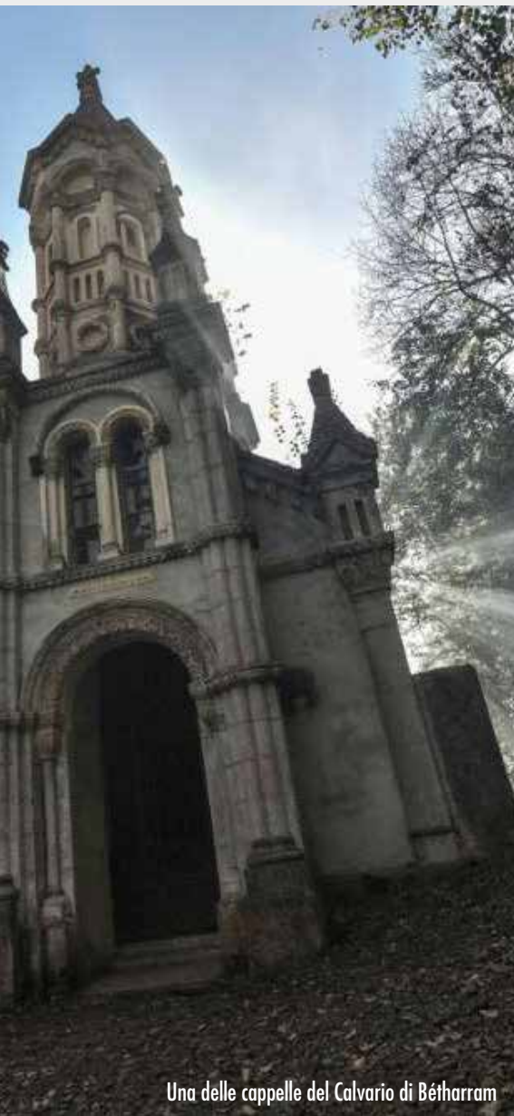
Una delle cappelle del Calvario di Bétharram